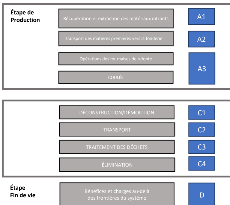
Figure 1. Schéma du processus de fabrication des billettes ayant lieu à Toronto